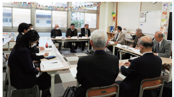
次期(2023-24) 東日本区役員会