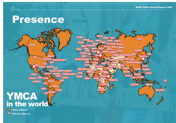
「世界のYMCA」 World YMCA Annual Report より

世界YMCA同盟の2022年事業報告書がサイト上に発信されました。YMCAビジョン2030の実現に向けたYMCAのプログラムについて詳しく紹介されています。